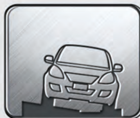
Caminos en desnivel