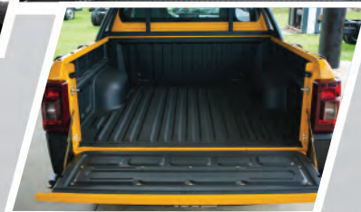
Capacidad de carga 820 Kg.