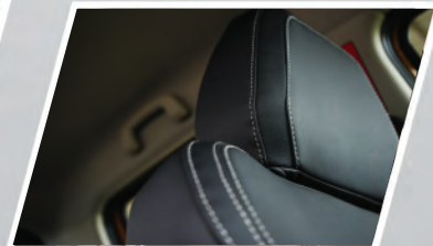
Diseño de estilo de costura a mano