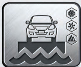
Adaptabilidad Ambiental Pruebas de calibración