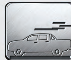
Prueba de alta velocidad

Las pruebas más difíciles dan como resultado a la ¡MEJOR CAMIONETA!