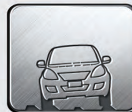
Caminos de piedras