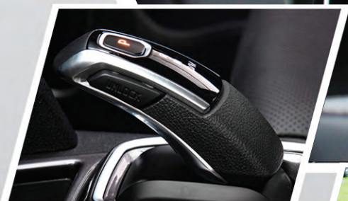
Palanca de cambios con estilo operativo de aeronave