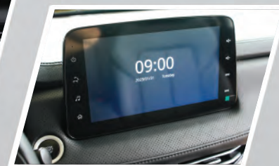
Pantalla touch de 10 pulgadas